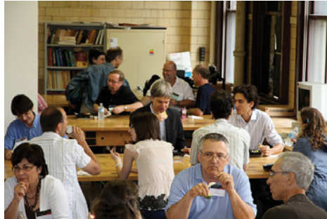
Des enseignants du collégial dans le cadre de la journée de «La physique à l'Université de Montréal» du 11 juin 2010